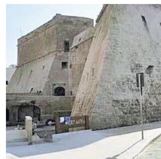
Il castello angioino di Mola

A Mola per la stagione dell'Agimus alle 21 nel Castello angioino Amadè di Jacopo Maria Dipasquale. Info associazionepadovano.it.